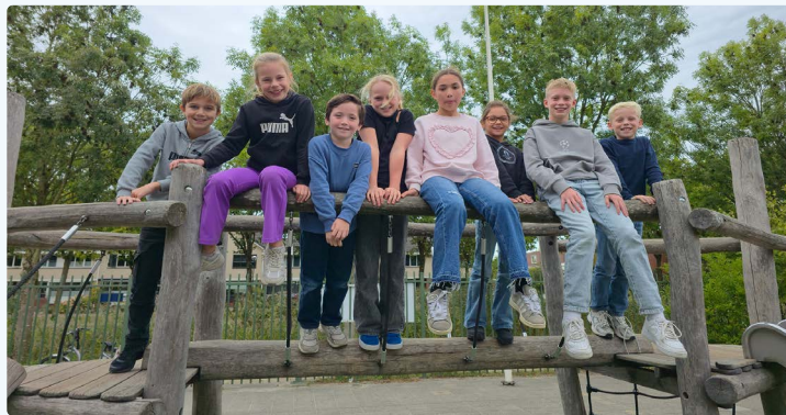
De leerlingenraad, met vertegenwoordigers uit de groepen 5 tot en met 8, adviseert de school. We zijn blij met ze!

De volgende 'BurchtBerichten' komt uit rond 26 juni.